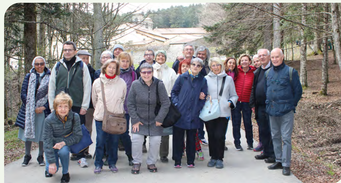
I pellegrini a Camaldoli