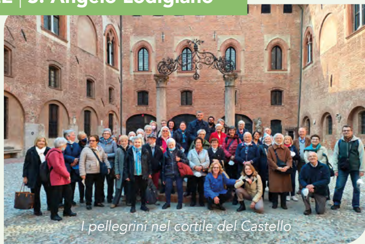
I pellegrini nel cortile del Castello