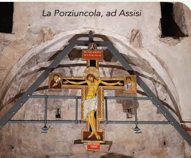
La Porziuncola, ad Assisi