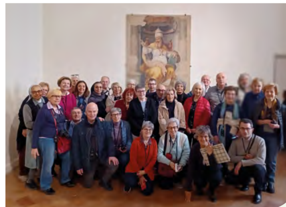
Sotto l'affresco raffigurante san Leone a Sansepolcro