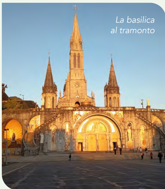
La basilica al tramonto