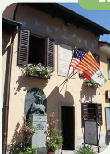
Casa natale di Santa Francesca Cabrini nata a S. Angelo Lodigiano nel 1850 e ricordata come la santa dei migranti