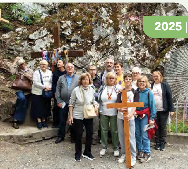
I pellegrini al termine della Via Crucis davanti alla pietra che rappresenta la Resurrezione