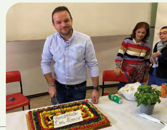
Un dolce ricordo dell'inizio di questo cammino insieme.