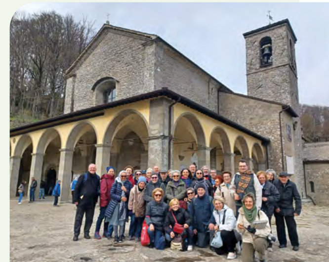
Riuniti a La Verna