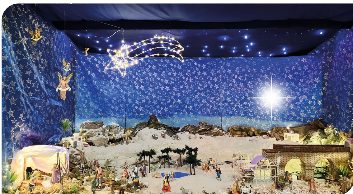
Il nostro Presepe

La vita di oggi ci dice che è molto facile fissare l'attenzione su quello che ci divide, su quello che ci separa. Oggi noi adulti - noi, adulti! - abbiamo bisogno di voi, giovani, per insegnarci - come adesso fate voi, oggi - a convivere nella diversità, nel dialogo, nel condividere la multiculturalità non come una minaccia ma come un'opportunità.