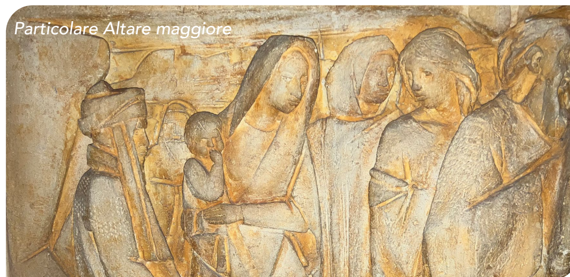
Particolare Altare maggiore

Guidaci e accompagnaci in questo servizio.