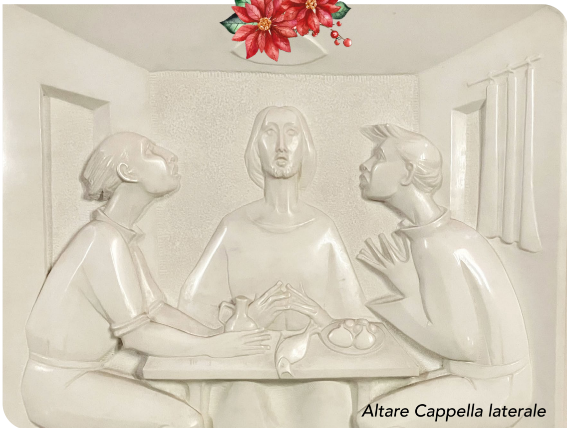
Altare Cappella laterale