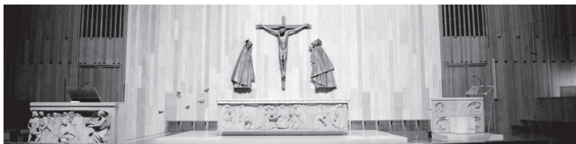
parrocchia san Leone magno papa