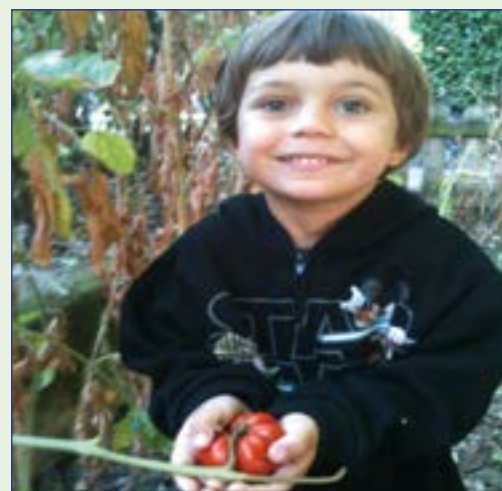
Un coltivatore in erba