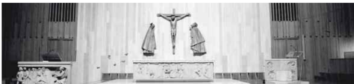
parrocchia san Leone magno papa